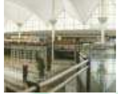
Tabla de Áreas de transporte