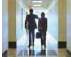
Tabla de Zona de tráfico y áreas comunes de edificios