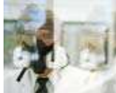
Tabla de Actividades industriales y artesanales